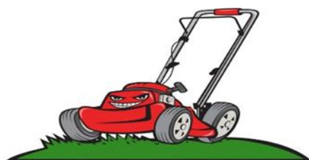
Zahradní technika Cvárovský